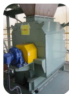
微粉用密閉ドラム