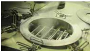
混合ラインで発生する異物の対策 マグネットと金属検出器の設置