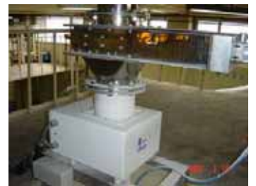
ライン中に マグネット+金属検出器